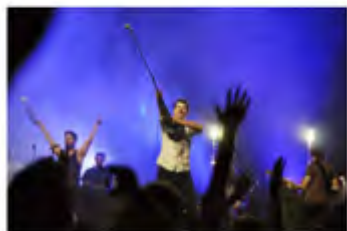
Delhi 2 Dublin et le groupe australien The Cat Empire (gauche) respectivement au spectacle du bout du monde samedi 13 août.

Jean-Philippe Thibault journaliste/monteur Publié le 14 août 2016