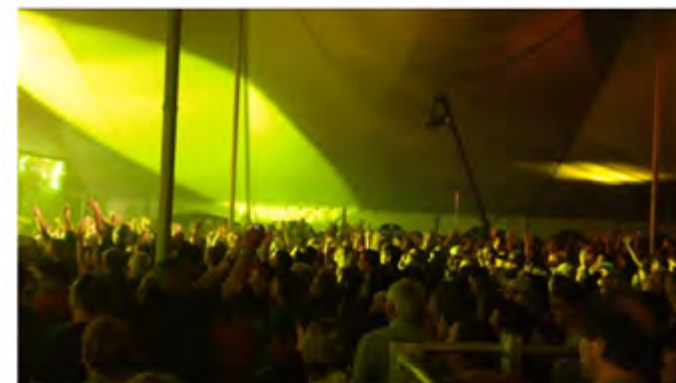
C'est la deuxième fois en treize ans qu'un spectacle sous le grand chapiteau affiche complet.