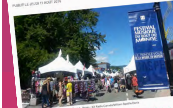
Le Festival Musique du bout du monde à Gaspé.

Tout est en place pour la grosse fin de semaine du 13 e Festival Musique du bout du monde, à Gaspé. Sous le grand chapiteau, le FMBM propose notamment les spectacles de Radio Radio et DJ Champion jeudi, tandis que les Cowboys Fringants et Cat Empire se produiront respectivement vendredi et samedi.